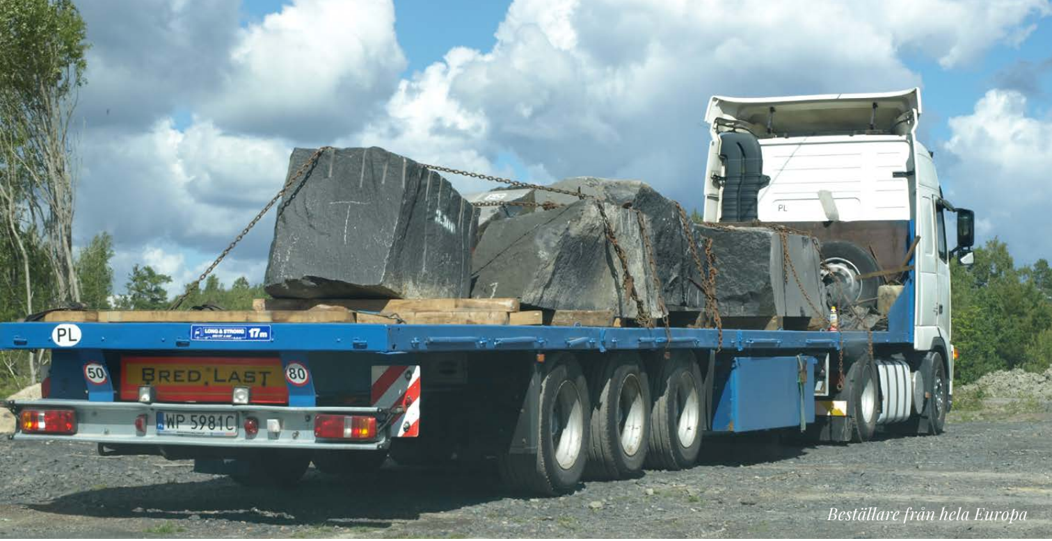
Beställare från hela Europa