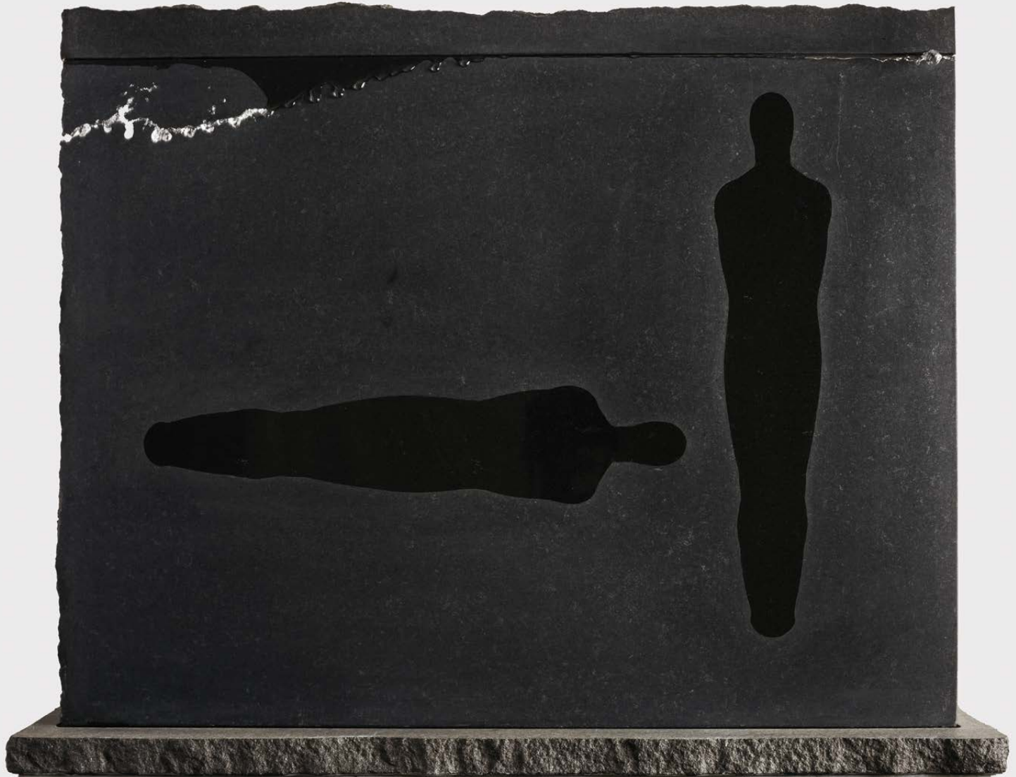
Vattenskulptur med silhuett FAS I