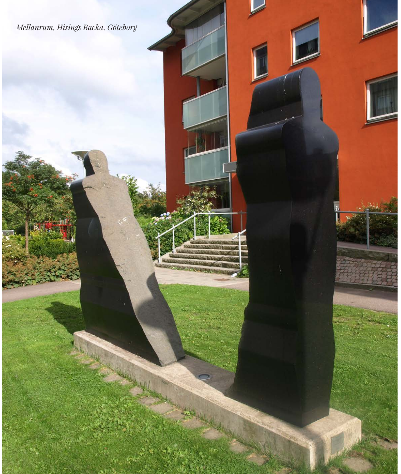
Mellanrum, Hisings Backa, Göteborg