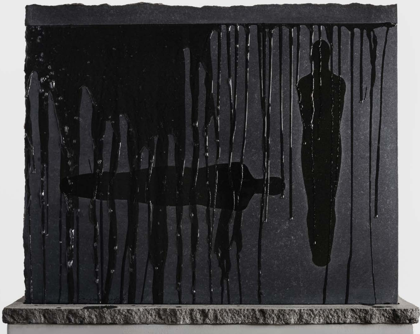
Vattenskulptur med silhuett FAS II