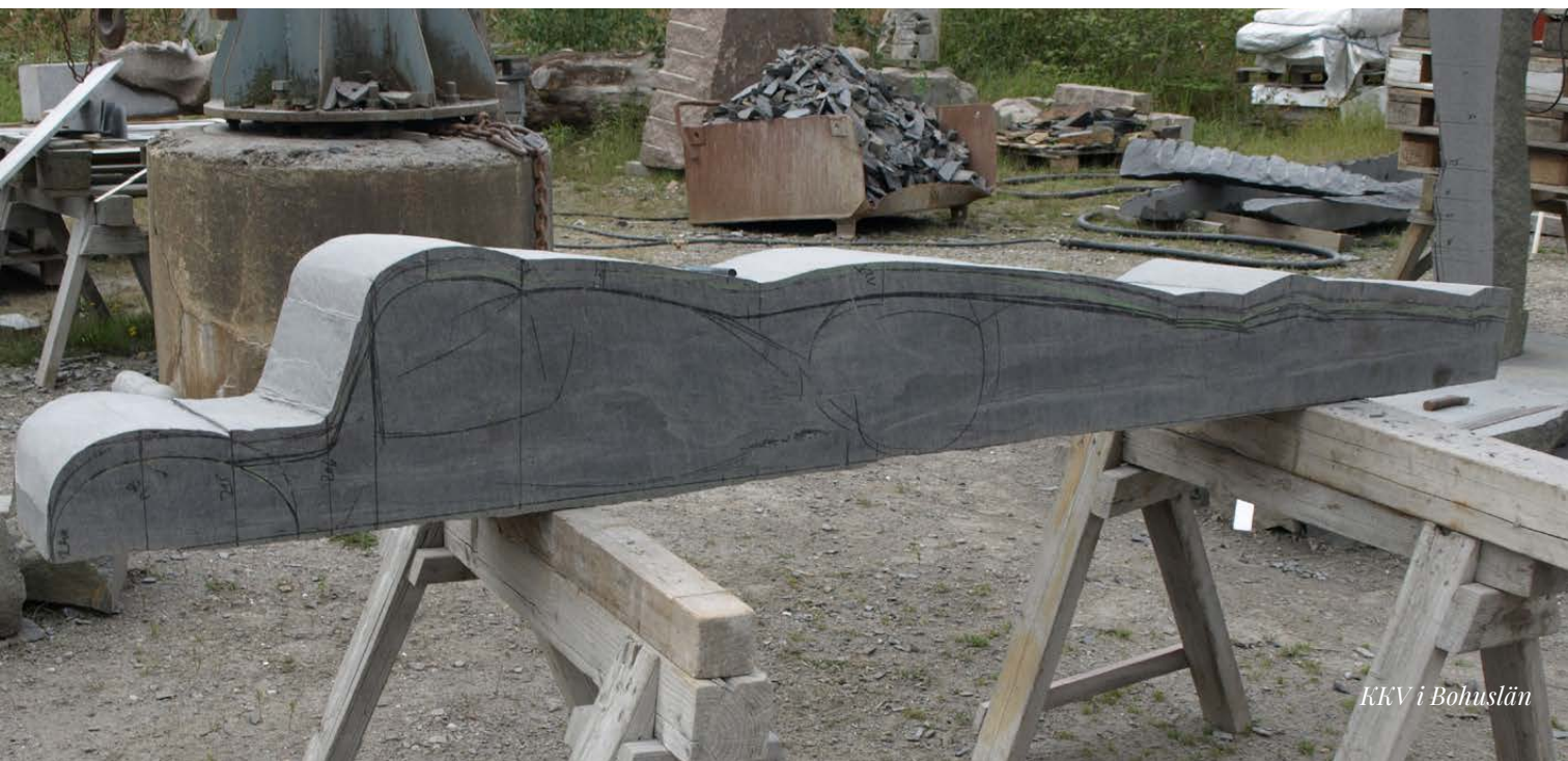
KKV i Bohuslän