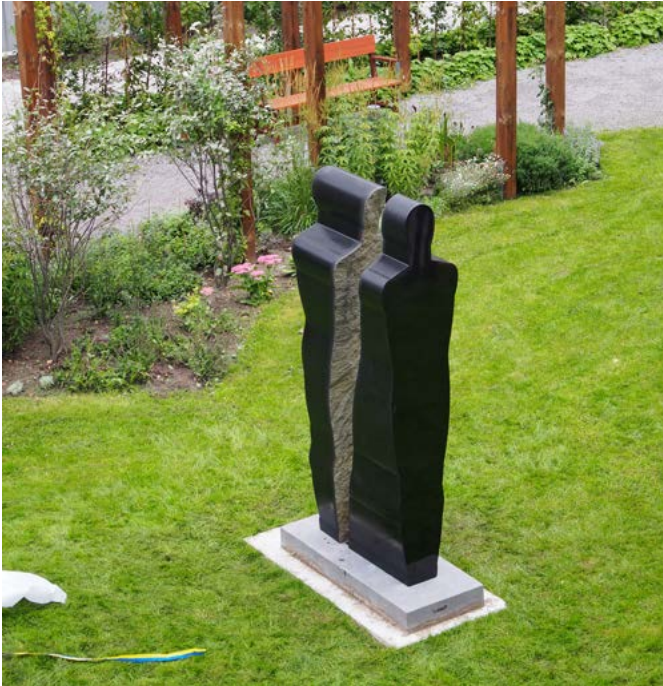
Skulpturen Möte, Norra Djurgårdstaden, Stockholm